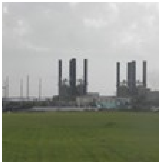
Kraftverket i Gaza