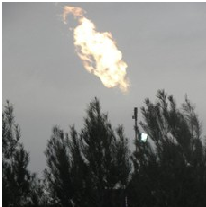
Avbrenning av gass ved Rantis.

Teamet har basert på denne informasjonen besøkt det aktuelle stedet og sett avbrenningen av gass, som finner sted. Dette peker klart i retning av oljeutvinning.